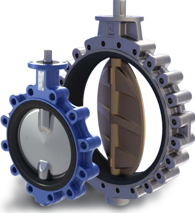
Wafer - Lug - Çift Flanşlı